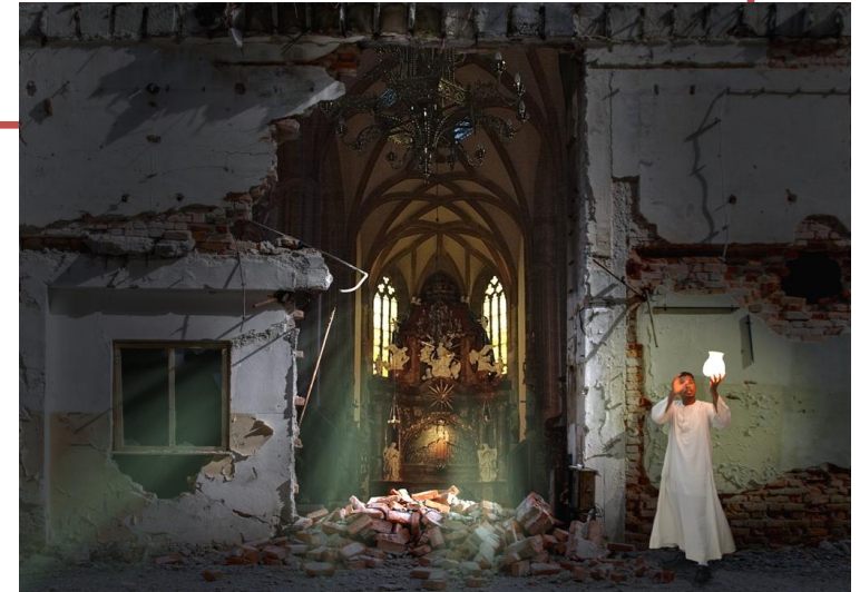
Je luč 2