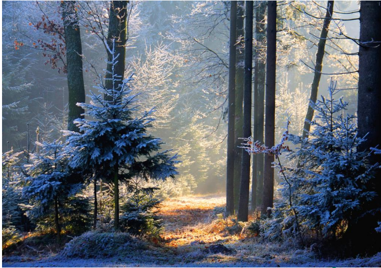
Pred zimo 1